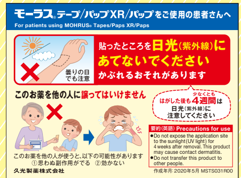
おやすり手帳用付箋