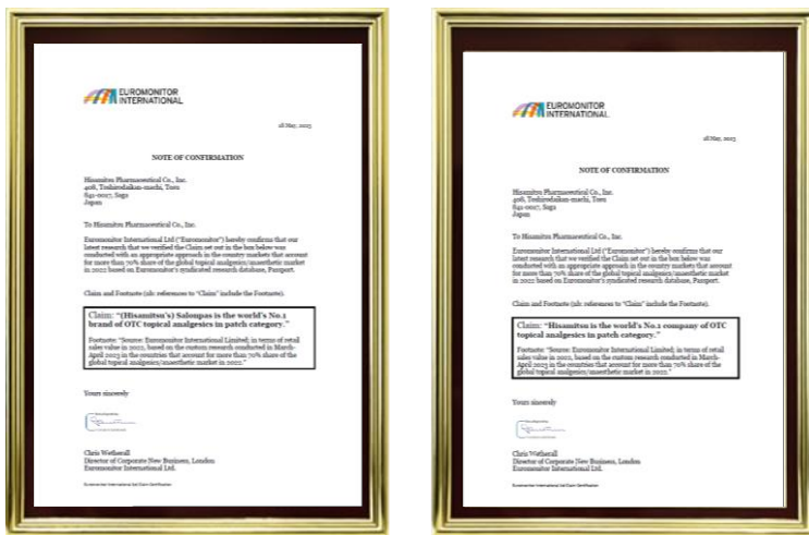
左)「Salonpas®」世界 No.1 ブランド認定書 右)久光製薬世界 No.1 企業認定書 ※本写真データをご希望の場合は、【本件に関するお問い合わせ先】までご連絡ください。

久光製薬株式会社(本社:佐賀県鳥栖市、代表取締役社長:中富一榮、以下「久光製薬」)は、英国のグローバル市場調査会社・ユーロモニター社(Euromonitor International Ltd.)より、OTC 医薬品(一般用医薬品)市場の鎮痛消炎貼付剤カテゴリーで、2016 年から 7 年連続で「Salonpas®」が販売シェア世界 No.1 ブランド※1 に認定され、その認定書を授与されました。また、同時に同カテゴリーにおいて、「久光製薬」が 6 年連続で販売シェア世界 No.1 企業の認定を受けました。