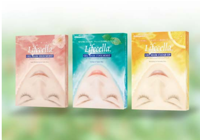
「ハイモイスト」「クールモイスト」「クリアアップ」 (しっとり保湿) (毛穴ひきしめ) (角質除去)

「ライフセラ ジェルマスク」は、その他に下記の 3 品をシリーズ展開しております。