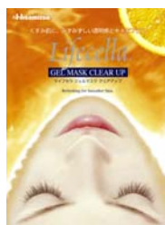
「クリアアップ」 (角質除去)