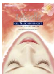
「ハイモイスト」 (しっとり保湿)