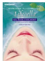
「クールモイスト」 (毛穴引き締め)