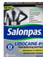
「サロンパス® リドカイン ペインリリービング ジェルパッチ」