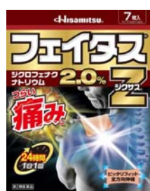
「フェイタス®Zジクサス®」