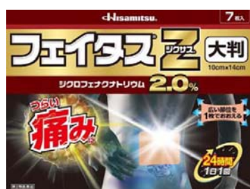
「フェイタス®Zジクサス®大判」