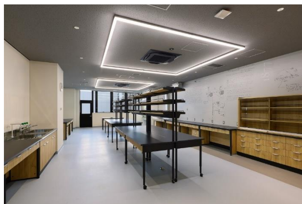
オープンラボラトリ