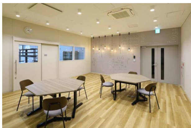
コラボレーションオフィス

加えて、SAGA グローバルリサーチセンターは、九州自動車道と長崎自動車道、大分自動車道が交差する鳥栖インターチェンジのすぐ横に位置していることから、車でのアクセスが容易です。周辺には、大学や研究機関が存在し、それら機関とのアクセスにも優れています。