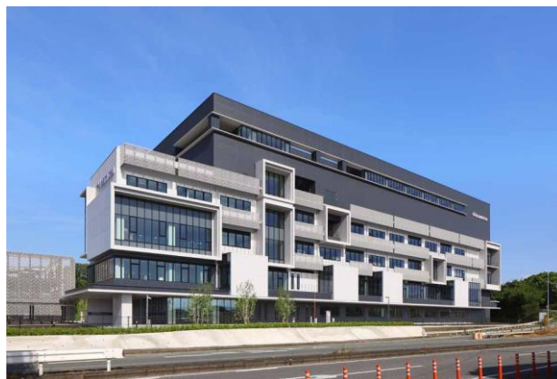
SAGA グローバルリサーチセンター

協業パートナーとの交流の場として、オープンイノベーションスペース、共同実験スペース(オープンラボラトリ)やコラボレーションオフィスも設置しており、協業パートナーと当社研究員と一緒にイノベーションに取り組む環境が整っています。また、共同研究により皮膚透過試験装置等、TDDS 製剤開発に特有の装置も協業パートナーに提供可能です。TDDS 製剤開発を専門とする当社研究員が、TDDS 製剤の試作・評価をサポートいたします。