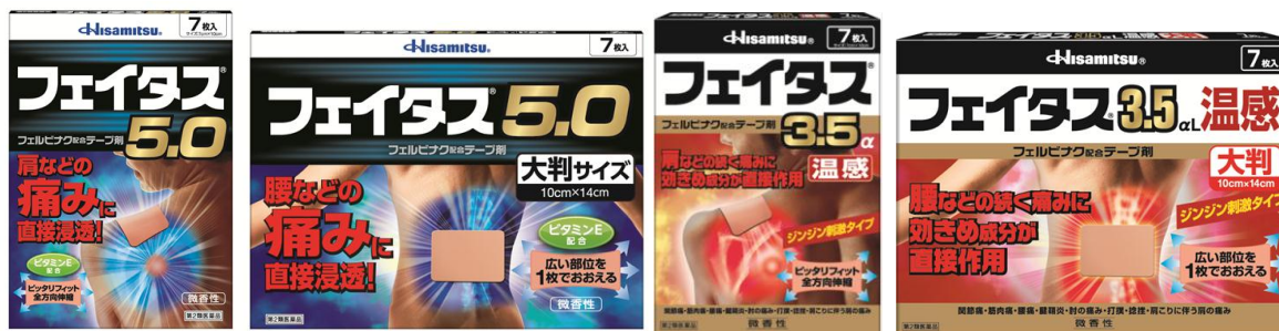
フェイタス®5.0 フェイタス®5.0 大判サイズ フェイタス®3.5α 温感 フェイタス®3.5αL 温感