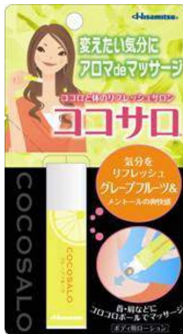
グレープフルーツ