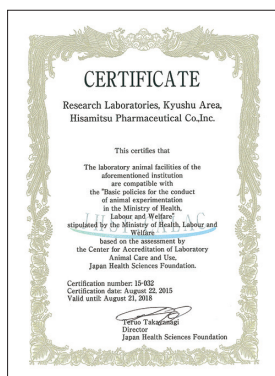
▲ 動物実験実施施設認定証

薬の有効性や安全性を確認する動物実験を行う場合、すべての実験を「動物実験委員会」で審査することを制度化しており、3Rの理念(Replacement: 代替法の選択、Reduction: 動物数の削減、Refinement: 苦痛の軽減)のもと研究を進めています。動物実験の実施体制については、定期的な自己点検に加えて、第三者機関であるヒューマンサイエンス振興財団(動物実験実施施設認証センター)による審査を受け、動物実験実施施設認定を取得しています。また、社内での動物福祉の精神を徹底するため、毎年教育訓練並びに動物慰霊祭を行っています。今後もさらなる動物実験の適正化と動物福祉の維持・向上に努めていきます。